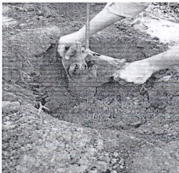
Hình 1b: Vừa lấp đất vừa kéo túi bầu