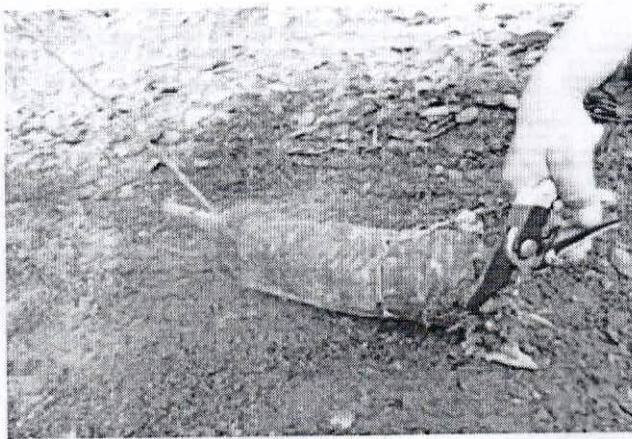
Hình 1a: Cắt rễ