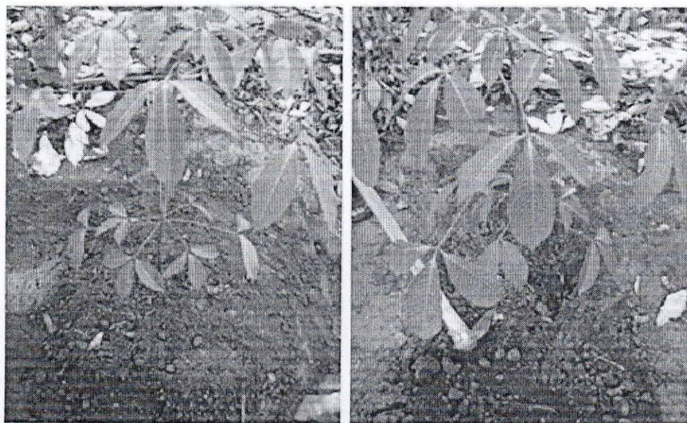
Hình 1c: Lấp đất và hoàn tất trồng